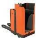
Cat. 1A transpalette à conducteur porté