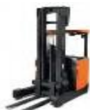
Cat. 5 chariot élévateur à mât rétractable