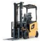
Cat. 3 chariot élévateur frontal en porte-à-faux (capacité nominale <6T)