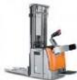
Cat. 1B gerbeur à conducteur porté