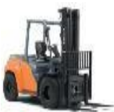
Cat. 4 chariot élévateur frontal en porte-à-faux (capacité nominale >6T)