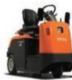
Cat. 2B chariot tracteur industriel